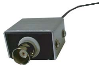
差動入力ヘッドステージ